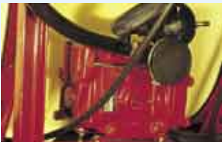
321/7.0 med sug- och tryckutjämnare.